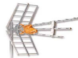
Antenn med LTE-filter